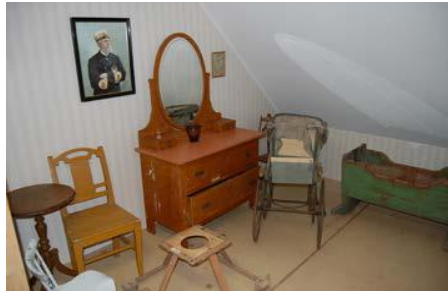
Interiör från sovrum

Även många av de föremål som användes i hushållet visas i sin rätta miljö som kök, sovrum och finrum