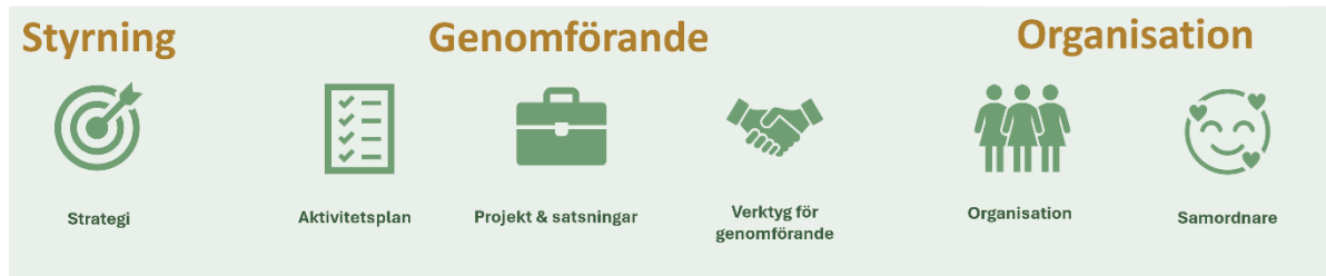
Figur 1 modell för styrning av hållbarhetsarbetet